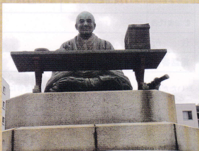
貝原益軒像（金龍寺）