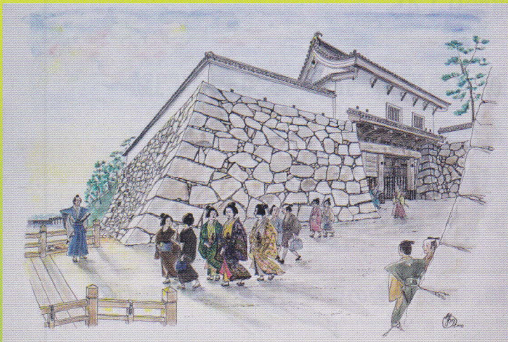
下之橋御門 明六ツに城下へ お出かけのお局たち