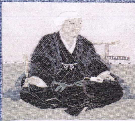
太閤秀吉をも恐れさせた 軍師・黒田官兵衛公

＊福岡城の礎を築いた如水公とは？城づくりの三大名人とも云われた如水公の足跡をたどり城内を巡る。