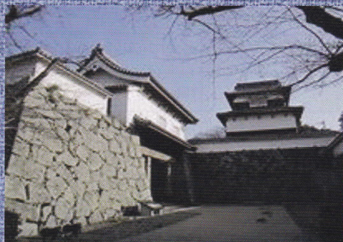
城内の櫓も公開 重臣屋敷跡等もご案内