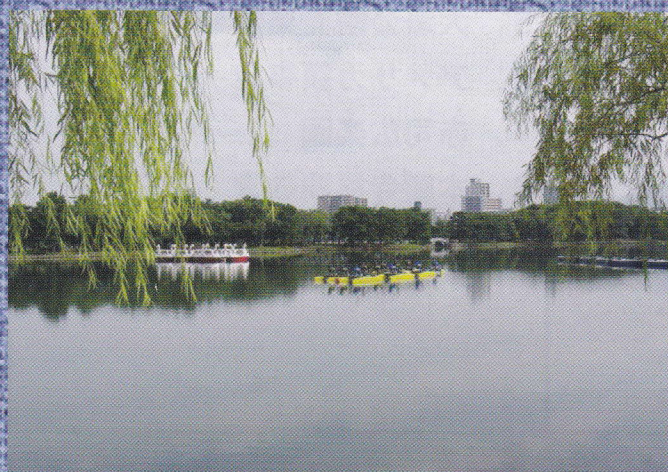
大堀が大濠公園となった変遷を たどります

＊大濠公園が福岡城防衛の大堀だったとご存じでしたか？ 大濠公園の今昔の史蹟を巡ります。