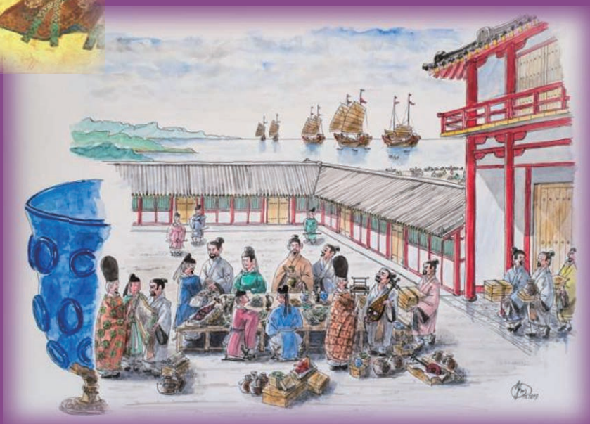
鴻臚館唐物交易 室川 康男 画